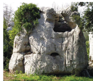
Le rocher des curés