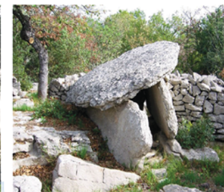
Dolmen au Ranc de Figères