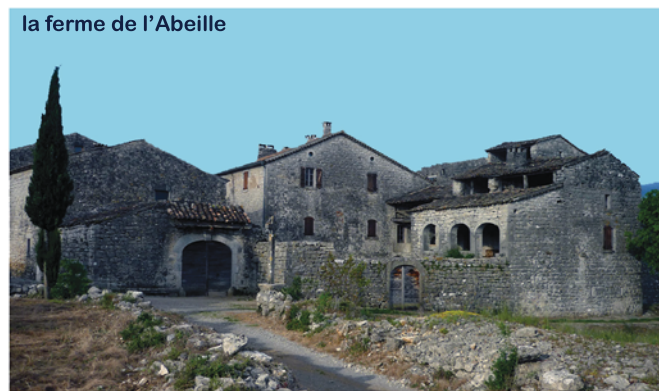
la ferme de l'Abeille