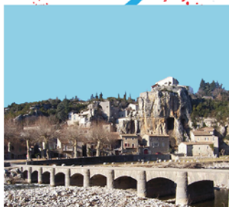
Le pont submersible