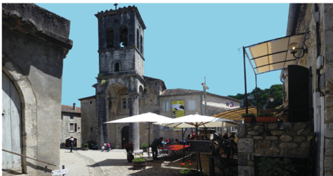
La place de l'église