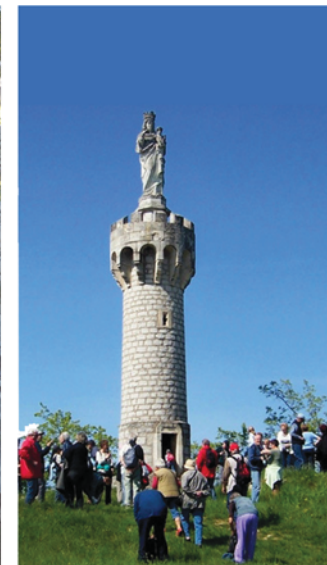
La tour de Chapias